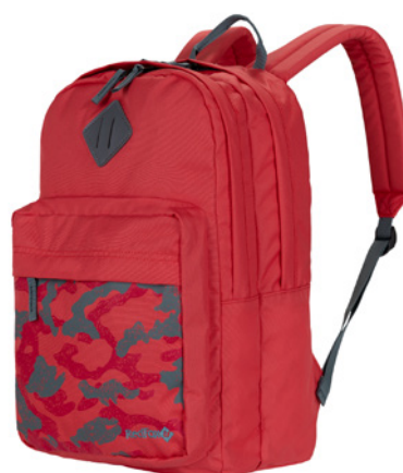
Book bag M2

RU Популярная серия рюкзаков Red Fox для активной жизни: для работы, школы, спортивного зала, отдыха за городом, поездок и путешествий.