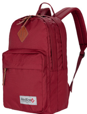
Book bag L2