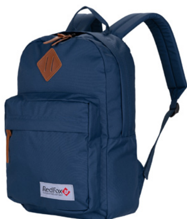
Book bag M1