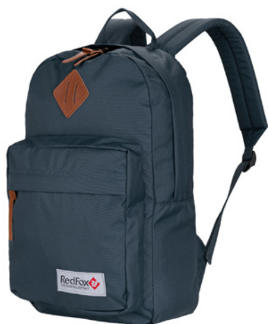
Book bag L1